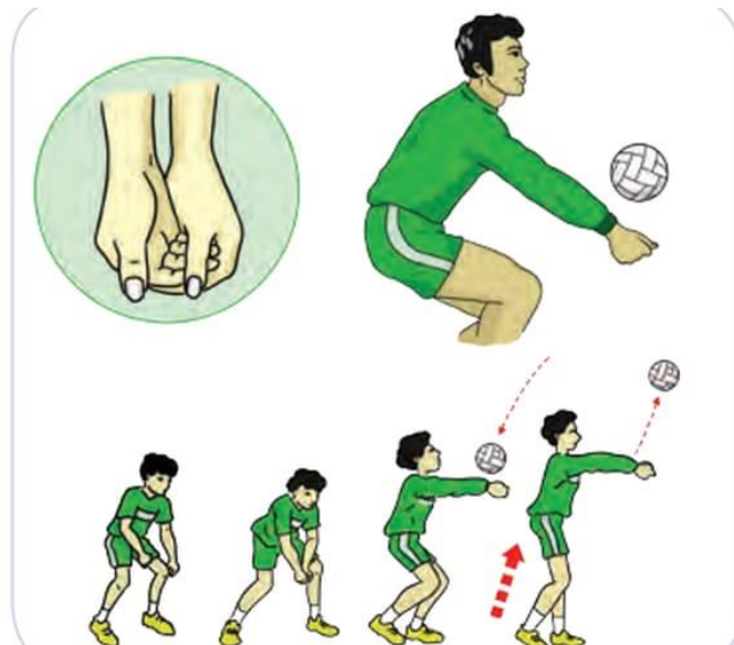
Gambar 2. 4 Passing Bawah