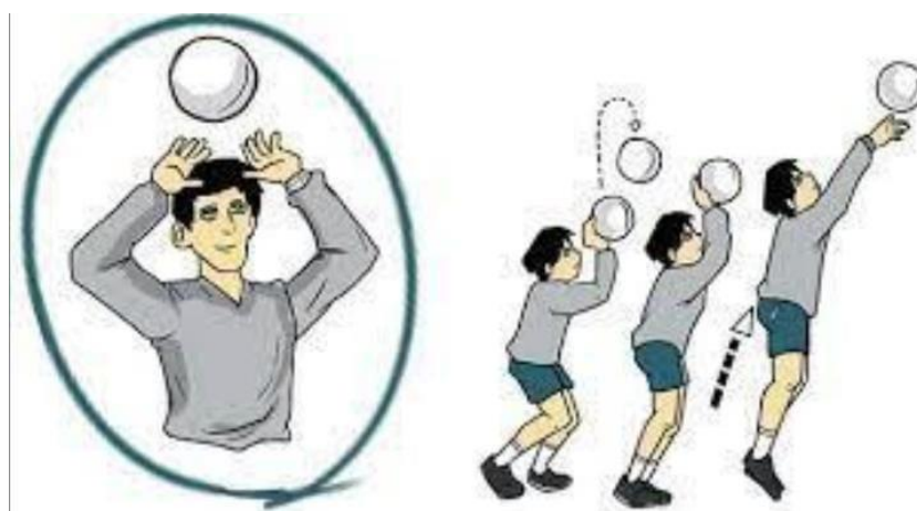
Gambar 2. 3 Passing Atas