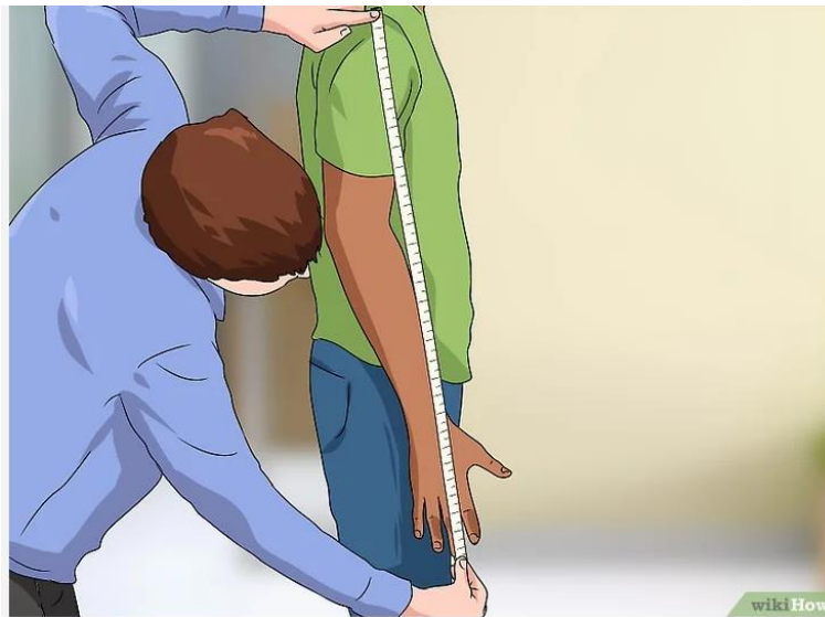
Gambar 2. 5 Cara Pengukuran Panjang Lengan